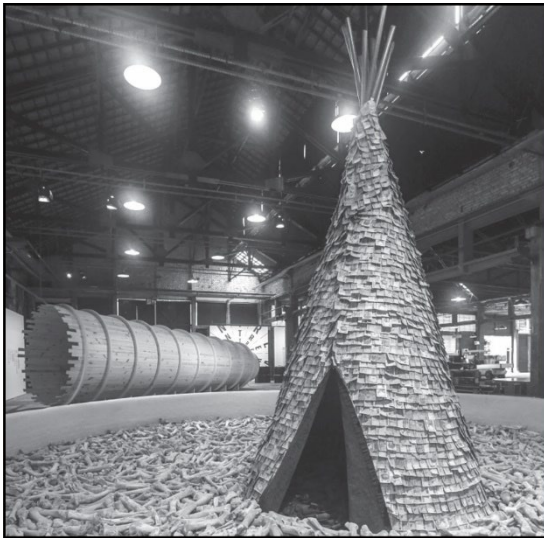
Cildo Meireles, Olvido , instalação (- 6000 cédulas de dinheiro de países do continente americano, carvão vegetal, 3 toneladas de ossos, tinta, aproximadamente 70 000 velas de parafina), 4,6 x 8 m, 1987-1989. Coleção do artista.

Disponível em: https://www.artrianon.com/2019/10/21/obra-de-arte-da-semana-olvido-de-cildo-meireles . Acesso em: 27 out. 2023.